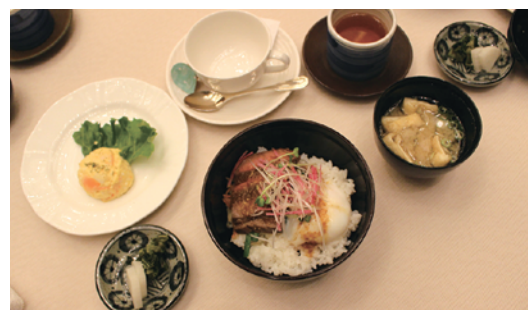
本日は100万ドルの食事例会です